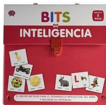
Bits de inteligencia