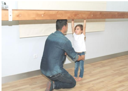
Escalera de braquiación