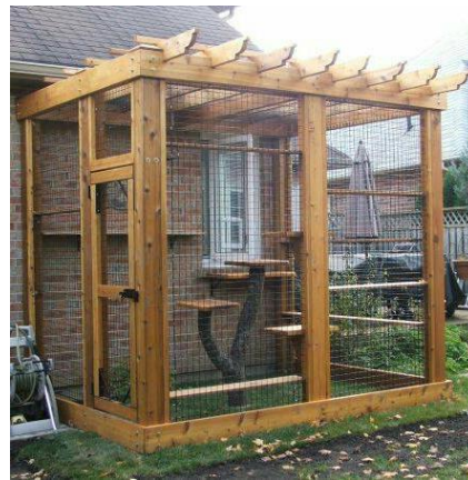
Foto: Refugio con zona exterior vallada.