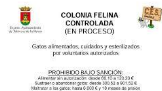
Fotos: Ejemplos de refugios callejeros y señalización colonias en otros ayuntamientos españoles.